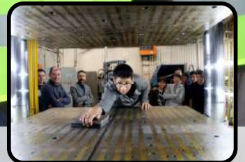
Bir Meslek Lisesinden Daha Fazlası TOBB Kütahya OSB M.T.A.L.