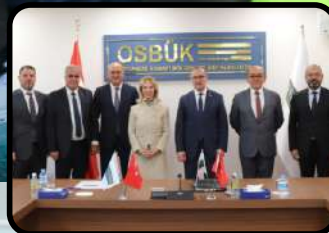
OSBÜK'de Kütahya Sanayisi Masaya Yatırıldı