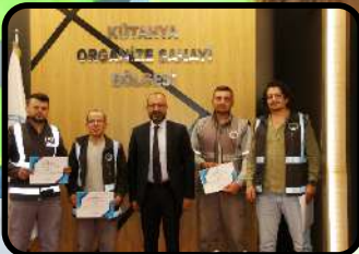
OSB Yönetiminden Personele Teşekkür