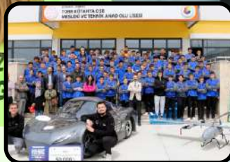
TEKNOFEST 2023 Şampiyonları Kütahya OSB'de