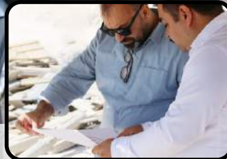
Projeler Tüm Hızıyla Devam Ediyor