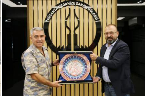
KÜTAHYA TUGAY KOMUTANI