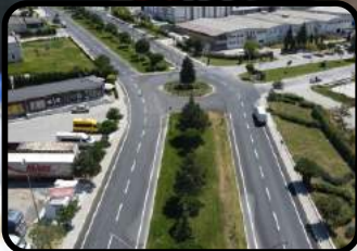
Yol Yenilemede Rota: “Nafi GÜRAL Caddesi”