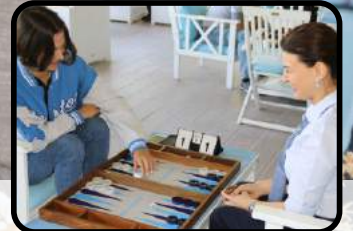
2. Geleneksel Firmalar Arası Tavla Turnuvası