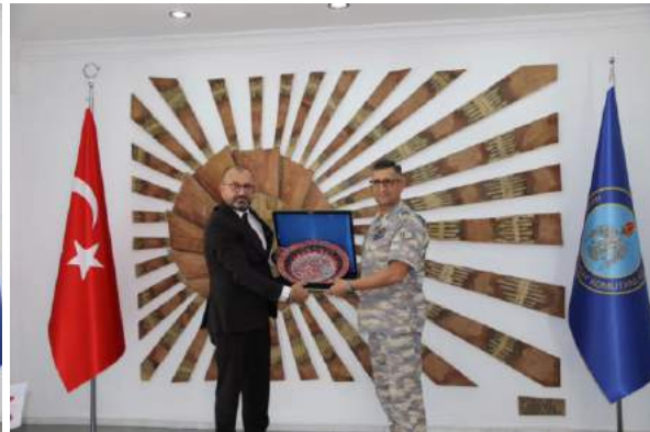
KÜTAHYA TUGAY KOMUTANI