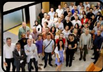
Kütahya'nın İnsan Kaynakları Kütahya OSB'de Buluştu